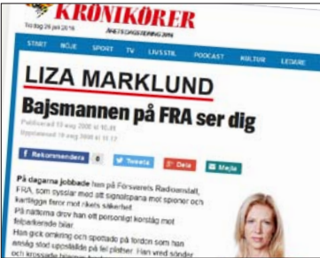
BLOGGKRIGET engagerar många människor, bland andra den så kallade "Bajsmannen" som även gjort Liza marklund till sitt hatobjekt.